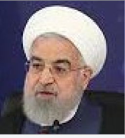
اینکه اجاره‌بهای که از فردا منقذ می‌شود تا کی معتبر است، محل بحث است.

اینکه اجاره‌بهای که از فردا منقذ می‌شود تا کی معتبر است، محل بحث است. تصمیم‌براین است از زمانی معتبر باشد که وزارت بهداشت شرایط این ویروس را از حالت اضطرار خارج کند. از آن تاریخ به بعد، قراردادها سه ماه دیگر تمدید می‌شود و بعد از آن سه ماه، موجر و مستأجر می‌توانند با توافق جدیدی با هم ادامه دهند.