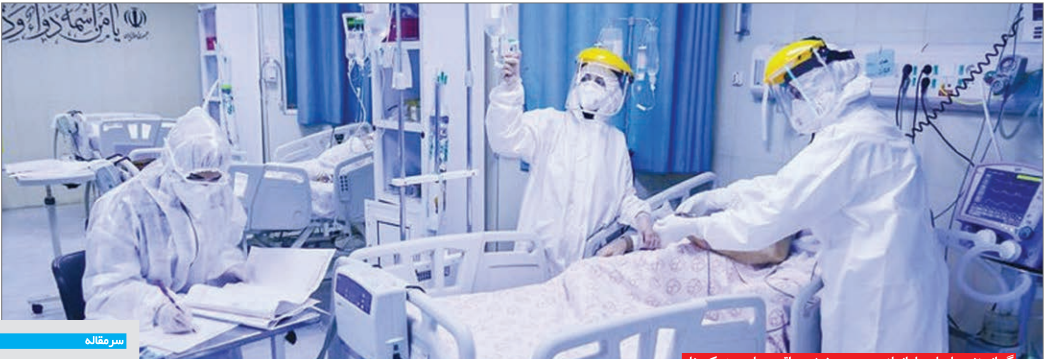
گمانه زنی ها برای راه اندازی سومین بخش مراقبت های ویژه کرونا