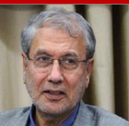
سخنگوی دولت در یادداشتی به نامه ۱۲ رئیس کمیسیون مجلس واکنش نشان داد و گفته: نامه چنان لحنی دارد

که گویی پیش از سال ۱۳۹۲ همه چیز بر وفق مراد بوده و تاریخ اداره کشور بالاخص در هشت سال دولت‌های نهم و دهم هیچ میراث ناگواری برای وضعیت اقتصادی، سیاست‌خارجی، سیاست‌داخلی، محیط زیست، فرهنگ و جامعه نداشته و دولت‌های یازدهم و دوازدهم اقتصادی بسامان، جامعه‌ای کم‌تنش، سیاست