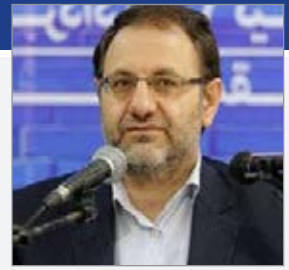
سید نظام الدین موسوی نماینده مردم تهران در مجلس شورای اسلامی گفت: با توجه به مسائلی که این چند

وقت داشتیم مسائل معیشتی فوری تر از بقیه مسائل هستند. در ماه‌های اخیر ایده‌های کرونا موجب شد بخشی از طبقات محروم جامعه آسیب جدی ببینند و فوریت دارد که مجلس با همکاری دولت برای اینها برنامه ریزی داشته باشد. در درجه اول تلاش مجلس بر این است که دولت در حوزه مسائل معیشتی و برنامه ریزی برای طبقات