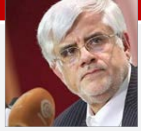
رئیس جمهور به برخی امور روز جمعه رسیدگی می‌کند

محمد رضا عارف، رئیس بنیاد امید ایرانیان گفت: تداوم حصر را به نفع منافع ملی نمی‌دانم و امیدوارم برای همگرایی بیشتر هر چه زودتر شاهد حضور این عزیزان در جمع یاران انقلاب باشیم.