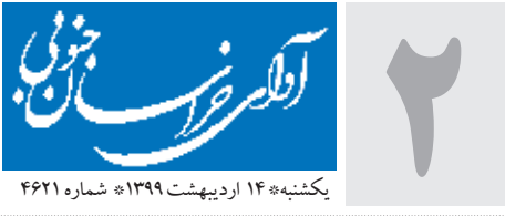
(لطفا نظر و پیشنهاد خود در رابطه با یادداشت‌های روزنامه را به شماره ۰۹۲۰۴۹۲۳۸۱ ارسال فرمایید)

۶ - جمله معروفیست که اتفاقاً نقل قولی از یک بازیگر مشهور است. او خطاب به جمع منتقدانش می گوید: «من نمی توانم کاری را که شما می کنید انجام دهم، شما هم نمی توانید کاری را که من می کنم انجام دهید، با همدیگر ما کارهای بزرگی می توانیم انجام دهیم.» ماجرا همین است، ما باید در کنار، نه کارهای بزرگی برای استان انجام دهیم، نه بازیگر با استعداد ما در سیطره متن فیلمش، عمدی برای قبول برخی صحنه‌ها و گفته‌ها و بازی آنها داشته و نه دست اندرکاران فیلم غرضی عامدانه داشته‌اند و نه هم ادب و فرهنگ و سنت‌های این دیار، آنقدر کم شأن و کم مقدار شده‌اند که قرار باشد با یک قرابت صحنه‌ای، دچار خدشه شوند. ما میراث بزرگی را به ارث برده ایم، میراثی که ادب، نزاکت، سعه صدر و صبوری و احترام به استعدادها و فرصت‌دانن به برخی غفلت‌های سهوی برای جبران، جزئی جدایی ناپذیر از آن است. بیرجند، آنقدر بزرگی و والایی دارد که در سال‌های آینده صدها فیلم درباره ظرفیت‌ها و تاریخش بسازند تا همه تلخی این روزها، حتی یکبار هم به یادمان نیاید. به همدیگر شربت شیرین فرصت را هدیه بدهیم، نه شرتگ تلخ توهین‌را.